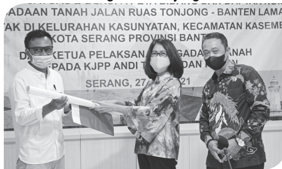
SERANG (IM)- Pengadaan tanah bagi kepentingan umum memiliki berbagai peran strategis yakni mendukung pembangunan infrastruktur, mendukung aktivitas perekonomian, mendukung kemudahan berinvestasi dan meningkatkan kesejahteraan rakyat.

Berbagai upaya dilakukan pemerintah agar proses pengadaan tanah ini dapat berjalan dengan cepat dan berkualitas. Salah satu upaya mempercepat proses pengadaan tanah, Kantor Wilayah Badan Pertanahan Nasional (BPN) Provinsi Banten menjadi pelaksana tiga kegiatan dari 11 kegiatan pengadaan tanah yang bersumber dari APBD Provinsi Banten yaitu kegiatan Pengadaan Tanah Pelebaran Jalan Ruas Pakupatan-Palima, Pengadaan Tanah Pembangunan Ruas Palima-Baros dan Pengadaan Tanah Jalan Ruas